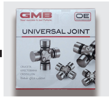
النمط غير مرئي عادة