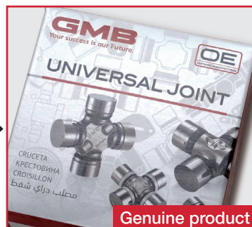
You can see the pattern by changing angle of view