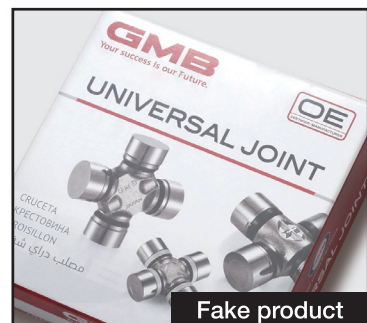
Fake product package doesn't have pattern printing