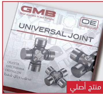
يمكنك أن ترى النمط عن طريق تغيير زاوية الرؤية