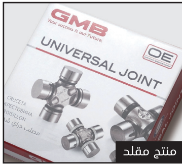
المنتج المقلد لا يوجد عليه نمط مطبوع

على الرغم من صعوبه الرؤيا من الجانب للجزء الامامي ، يمكنك ان ترى الليثوفان لمصلب الدراي شفت والمطبوع بطباعه خاصه عند النظر اليه من خلال الضوء المنعكس بزوايه متغيره. وبما انه عباره عن طلاء شفاف، فإنه غير مرئي عادة. ومع ذلك، فإن النمط يظهر بوضوح عندما تسليط الضوء عليه. فمن السهل تمييز المنتج المقلد لأن هذا النمط لم يتم طباعته