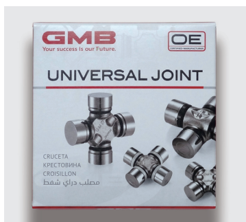
Pattern is not normally visible

As it is a transparent coating, it is not normally visible. However, pattern will clearly appear when light hits it. It is easy to distinguish the fake product package because this pattern has not been printed.