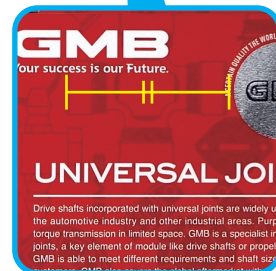
حتى لو كان حجم التغليف مختلف، فإن حجم النمط سيبقى نفسه