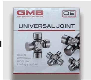
النمط غير مرئي عادة