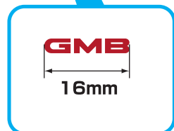
Even if the size of individual box is different, the size of pattern is the same