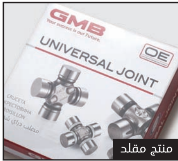
المنتج المقلد لا يوجد عليه نمط مطبوع

على الرغم من صعوبه الرؤيا من الجانب للجزء الامامي ، يمكنك ان ترى الليثوفان لمصلب الدراى شفت والمطبوع بطباعه خاصه عند النظر اليه من خلال الضوء المنعكس بزوايه متغيره. وبما انه عباره عن طلاء شفاف، فإنه غير مرئي عادة. ومع ذلك، فإن النمط يظهر بوضوح عندما تسليط الضوء عليه. فمن السهل تمييز المنتج المقلد لأن هذا النمط لم يتم طباعته