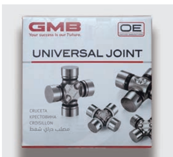
Pattern is not normally visible

As it is a transparent coating, it is not normally visible. However, pattern will clearly appear when light hits it. It is easy to distinguish the fake product package because this pattern has not been printed.