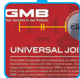
حتى لو كان حجم التغليف مختلف، فإن حجم النمط سيبقى نفسه